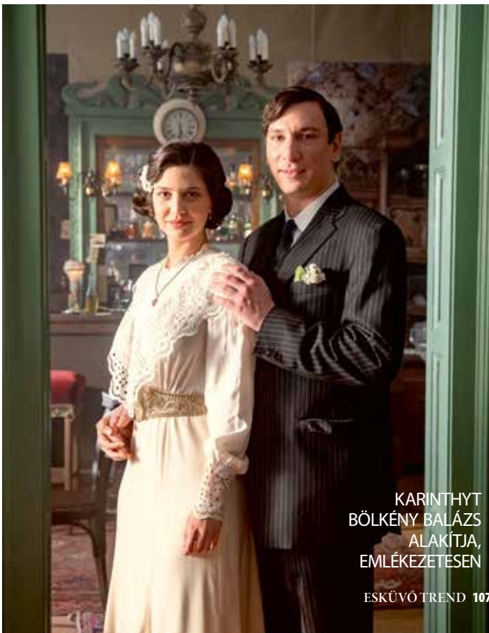
KARINTHYT BÖLKÉNY BALÁZS ALAKÍTTJA, EMLÉKEZETESEN